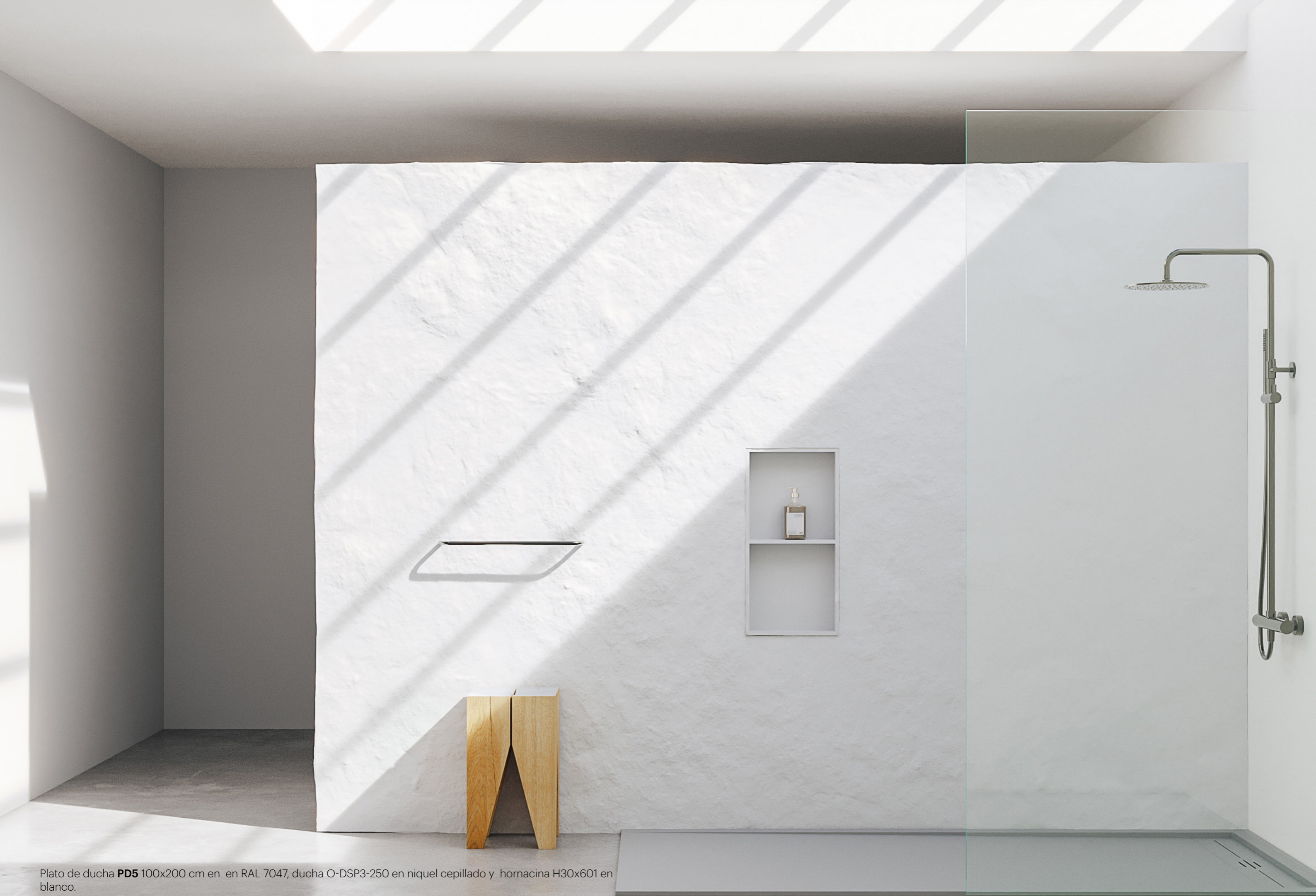
Plato de ducha PD5 100x200 cm en en RAL 7047, ducha O-DSP3-250 en níquel cepillado y hornacina H30x601 en blanco.